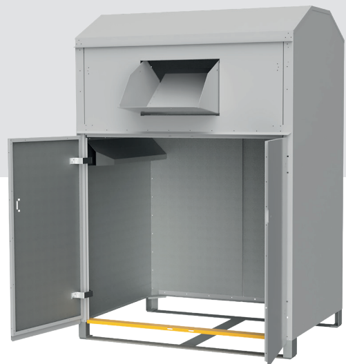
EasyELEC mit Quertraverse